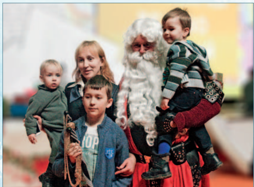
Желания детишек – закон для Деда Мороза