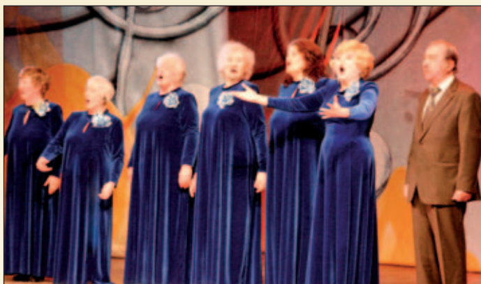
Победитель смотра-конкурса «Песни прошлых лет» ансамбль «Будь здоров!» (ПВТ №31)

Серебряные призеры смотра-конкурса участники коллектива «Завалинка» филиала «Печатники» ТЦСО «Кузьминки» (ЮВАО) задорно пели о том, что с песней они никогда не расстанутся, и при этом играли на разных народных музыкальных инструментах – гармонии, дудочке, бубне, ложках, трещотке. Самодеятельные артисты явно получали огромное удовольствие от своего исполнения и слушателям тоже доставляли немалую радость.