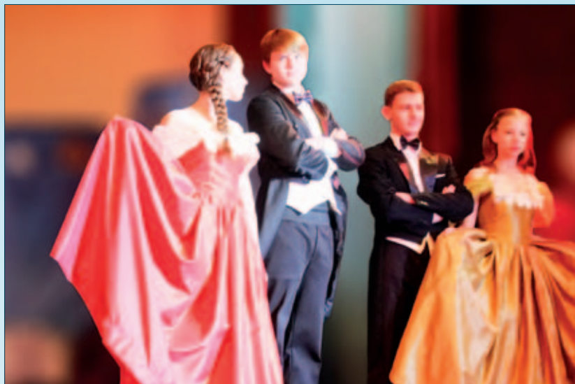
Визитка театральной студии «Сюрприз»