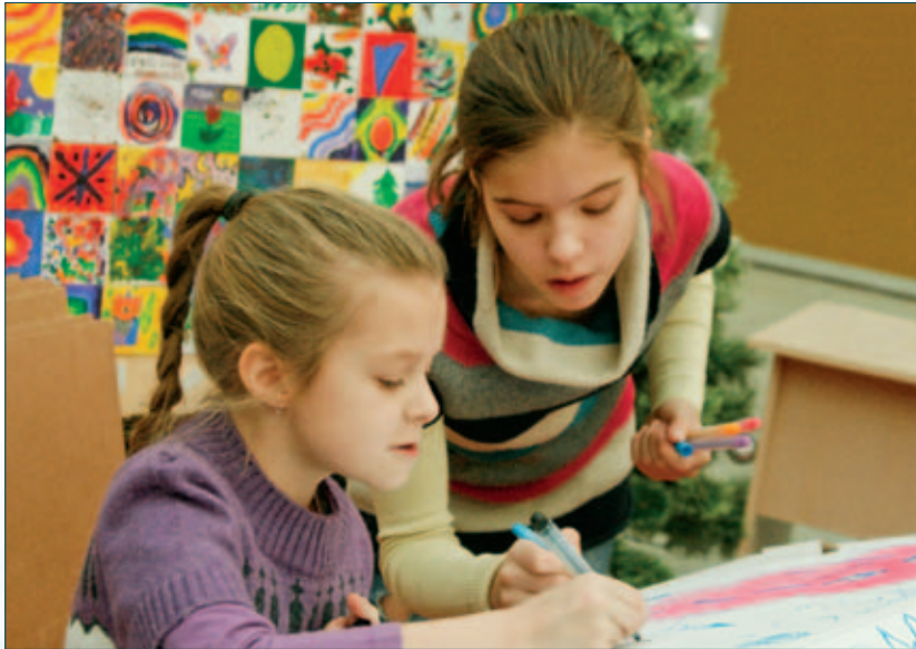
Творческие задачи для строителей Города Добра

Сосредоточенные, с помощью карандашей, красок, кистей, ножиц и скотча, дети украшали и разрисовывали картонные дома и дороги.