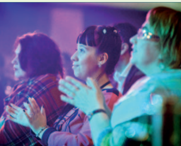
Участники торжественного вечера, посвященного Международному дню инвалидов

ни Н.Э. Баумана, работала там инженером на кафедре подъемно-транспортных машин и преподавала математику на подготовительных курсах, пока не случилась травма с переломом позвоночника.