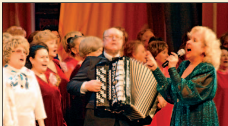
Заключительный выход участников гала-концерта

Каждый хоровой или песенно-танцевальный коллектив – это своеобразный островок добра и сердечности, где в дружелюбной атмосфере сплотились люди разных профессий и судеб, которых объединили души прекрасные порывы.