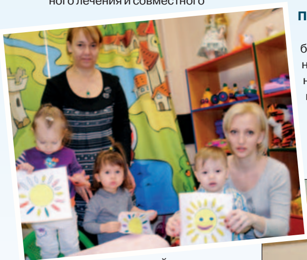
В ЦСПСиД «Хорошёвский»

В течение 2014 года этой категории населения было оказано более 6000 услуг, включая содействие в трудоустройстве, помощь в оформлении пособий, льгот и жилищных субсидий. Молодых людей