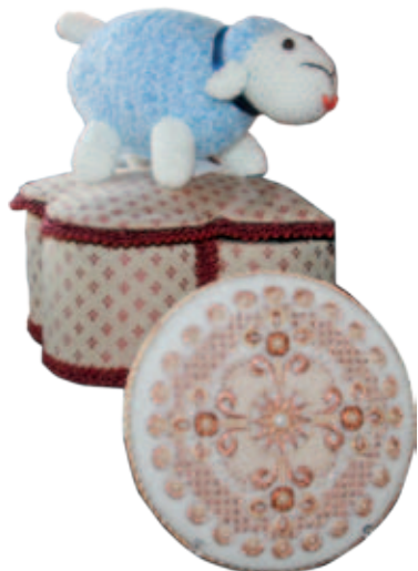
Среди экспонатов выставки – декоративная овечка, символ будущего года по восточному календарю