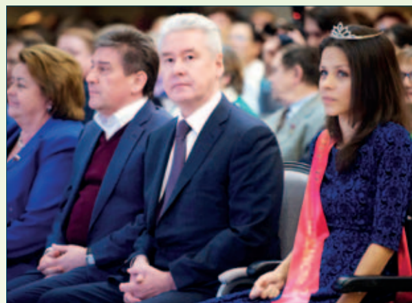
Мэр Москвы С.С. Собянин, Министр Правительства Москвы В.А. Петросян и Мисс Независимость–2014 Елизавета Устинова

У нас развит социальный туризм. Проводим много экскурсий по Москве, ездим по городам России, были в Белоруссии, для чего заказываем специальные низкопольные автобусы. Программа «Доступный транспорт» ориентирована на то, чтобы нам было удобно, чтобы мы чувствовали себя равными