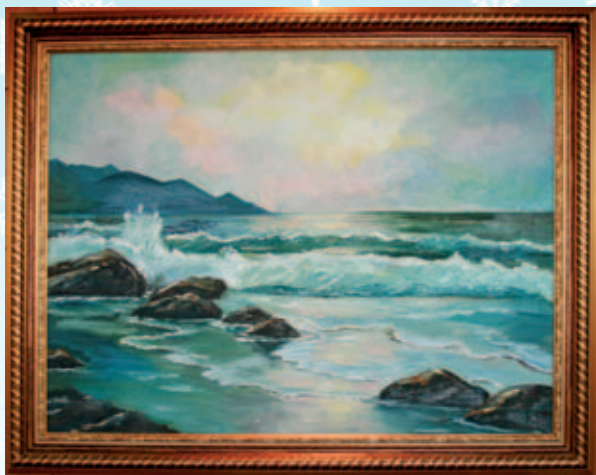
Н.А. Данилюк «Морской пейзаж»