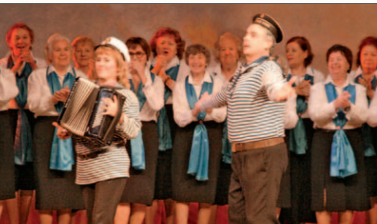
Серебряный призер смотра-конкурса коллектив «Завалинка» (ЮВАО)