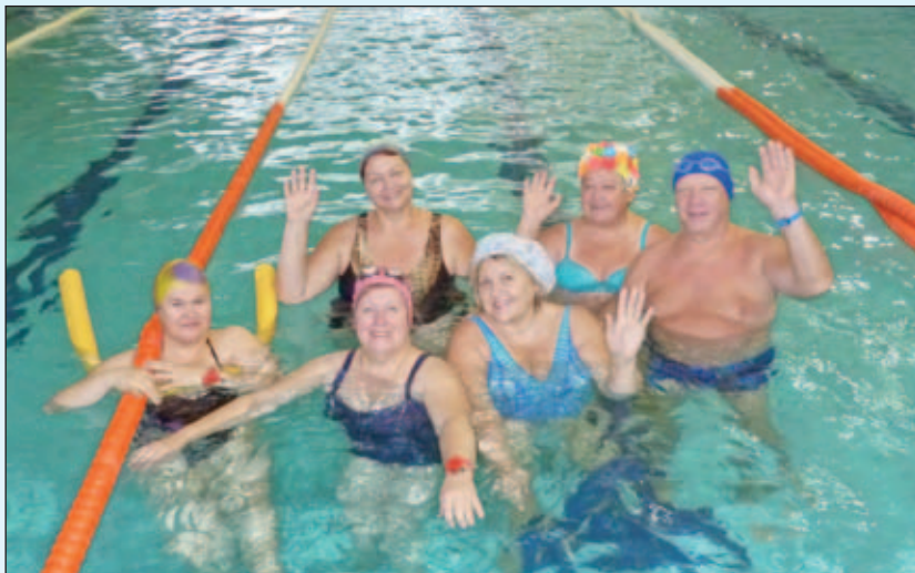
Клиенты отделения социальной реабилитации инвалидов ТЦСО «Бескудниково» в бассейне ФОК «Академический»

меньше. При езде на рукомобиле задействованы 95% мышц.