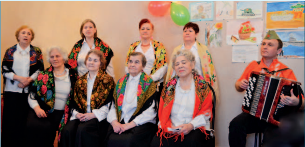
Хоровой коллектив ТЦСО «Тимирязевский»

решила обучаться на компьютерных курсах.