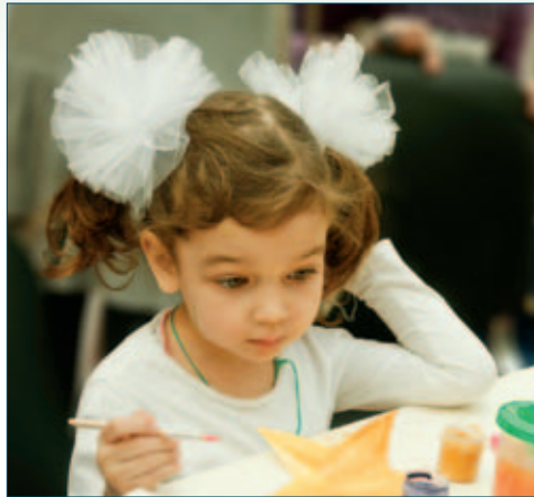
Нарисую много золотистых звезд

– Наступает Новый год, праздник, любимый всеми детьми. Печально, если даже в такой день не у всех детей могут исполниться самые заветные желания, но у нас есть шанс это исправить. Весь год мы помогаем сделать ваш дом самым уютным и неповторимым, но сегодня мы хотим помочь детям провести самый незабываемый день в их жизни: исполнить хотя бы несколько заветных желаний.