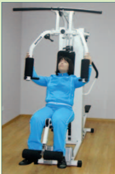
Реабилитационные услуги в ТЦСО «Марьино»

Центры занятости предлагают банк вакансий, но для инвалидов с высшим образованием там практически нет ничего подходящего. Мы продолжаем работу с новым руководством Департамента труда и занятости и надеемся на понимание. Ежегодно создается более 2,5 тыс. рабочих мест для инвалидов. Согласно государственной программе, должно быть организовано 12,5 тыс. мест. Мэром Москвы Сергеем Семёновичем Собяниным поставлена задача органам исполнительной власти принимать инвалидов на работу в государственные учреждения, в систему государственного управления. Почти 11 тыс. инвалидов устроены в органы исполнительной власти Москвы, из них 1,5 тыс. работают в системе Департамента социальной защиты населения города Москвы. Но проблема все равно стоит остро, и мы от нее уходить не можем. Департамент труда и занятости сейчас вырабатывает новую идеологию поддержки работодателей, которые применяют труд инвалидов. Надеюсь, скоро мы ознакомимся с этой идеологией.