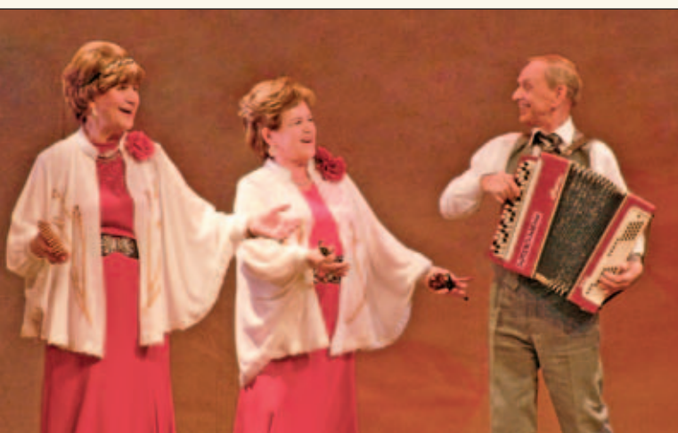
Участники хорового коллектива «Годы золотые» (ЦАО)

Хор «Годы золотые» ТЦСО «Таганский» (ЦАО), завоевавший почетное 3 место, свою музыкально-хореографическую композицию «Жемчужина Одессы – ты гордость и краса» начал с лихого «Яблочка». А припев знаменитой песни Леонида Утёсова «Ты одессит, Мишка» солисты исполняли особенно эмоционально.