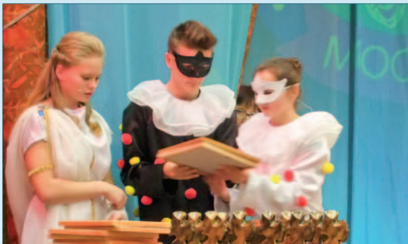
Муза Мельпомена с помощниками готовит грамоты для своих верных поклонников

Достижения ребят на заочном этапе фестиваля по видеомате-