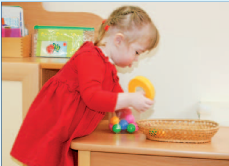
Соню очень интересует баночка с разноцветными шариками