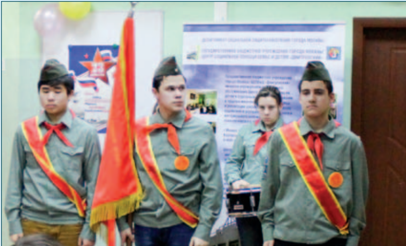
В ЦСПСиД «Хорошёвский»

активно вовлекают в волонтерскую деятельность по оказанию помощи ветеранам и детям с инвалидностью. А это постепенно становится мотивацией к труду.