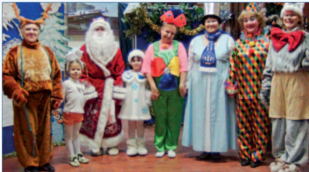
Новогодний спектакль театральной студии «Экспромт» ТЦСО «Хорошёвский»

В рамках новой программы «Стилизация души» в Центре «Дмитровский» открывается Школа дизайнера и моды для социально неблагопо-