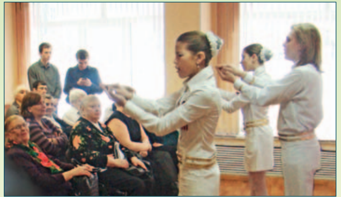
Познавший мир безмолвия творит собственные миры

– Интересно, почему для проведения Всероссийского фестиваля был выбран Сочи?