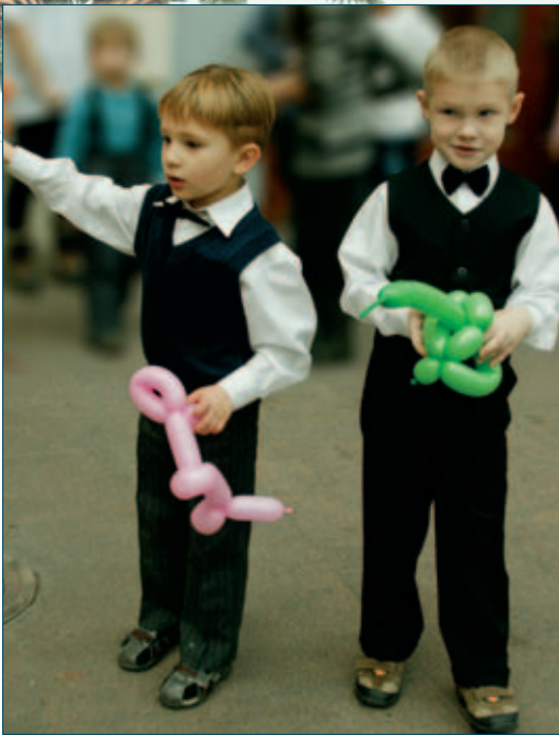
В Городе Добра некогда скучать