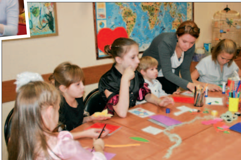
В ЦСПСиД «Коптево»

В сентябре в Центре открылась Инженерная школа, где ребята вместе с преподавателями сами чинят рукомобилы в случае поломок. Эта методика работы интересна и в качестве профилактики асоциального поведения подростков, для которых, кстати, предусмотрено еще одно новшество. В сотрудничестве с само-