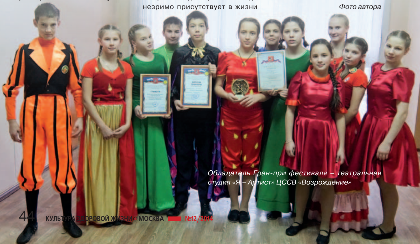
Обладатель Гран-при фестиваля – театральная студия «Я – Артист» ЦССВ «Возрождение»